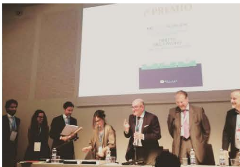
I vincitori della Sezione Diritto del lavoro e relazioni industriali.

lavoro in Milano, è quello di lanciare un messaggio: aiutare gli operatori a fare il meglio il proprio lavoro, a dare un contributo. Noi andiamo alla ricerca di quei testi che danno quel qualcosa in più che ci aiuti a svolgere meglio il nostro lavoro. Cerchiamo in un testo la semplicità e la fruibilità, senza perdere quella scientificità che è necessaria per svolgere la nostra attività professionale. Un approccio sistematico, completo e utile alla nostra professione.